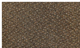
921 - Castor