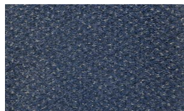
922 - BB2