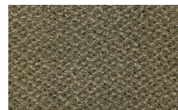
920 - Avocado