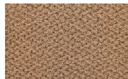
908 - Civet