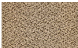
918 - Beige